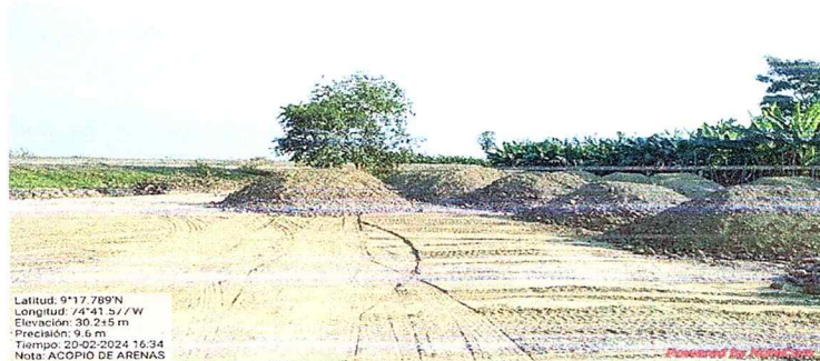
Imagen 2-3. Área de acopio de 28 pilas de arenas