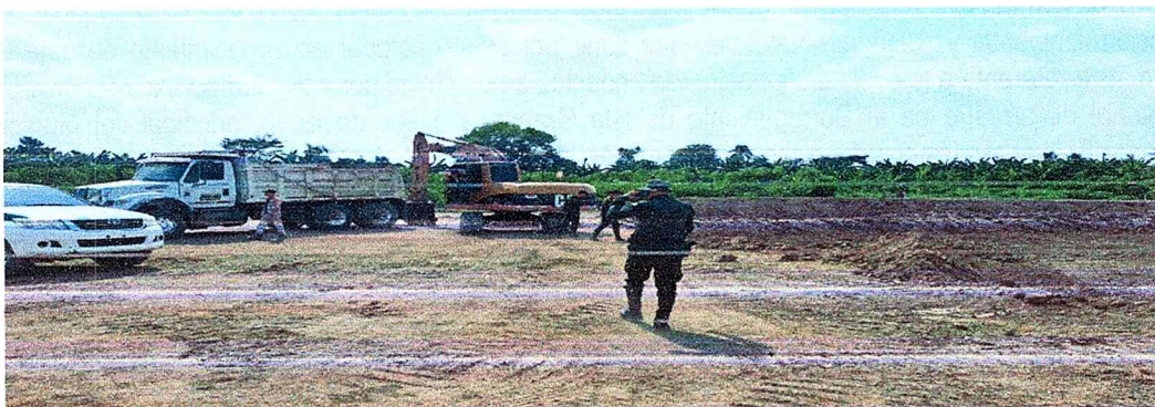
Imagen 4. Maquinaria amarilla identificada por la Policía Nacional.