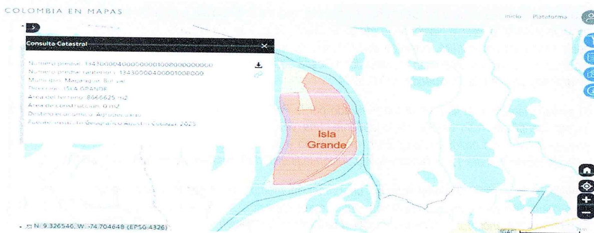
Figura 1. Consulta IGAC

Realizada la consulta en el Geoportal del IGAC con las coordenadas anteriores, el predio se encuentra en el área de la Isla Grande con Número predial: 134300004000000001008000000000, con destino económico: Agropecuario.